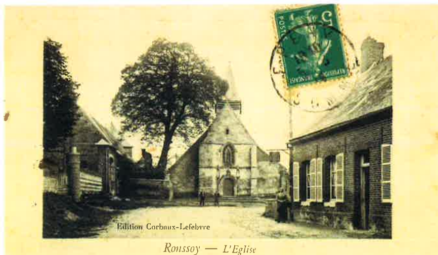
A gauche, l'entrée du château ; au centre, l'église avant sa destruction pendant la Première Guerre Mondiale, construite à la place de l'actuelle Salle des Fêtes.

R e s s o y ( S o m m e ) - L ' E g l i s e