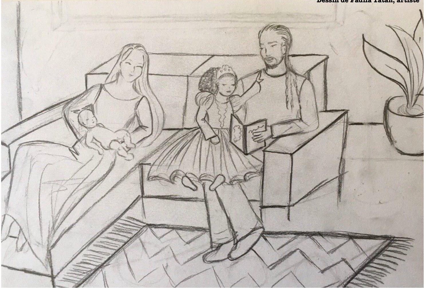
Dessin de Fadila Tatab, artiste