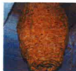
Trou d'entrée du nid au dessous