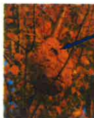
Trou d'entrée du nid sur le côté

peut atteindre 80cm de diamètre La plupart du temps dans les arbres à des hauteurs d'une quinzaine de mètres