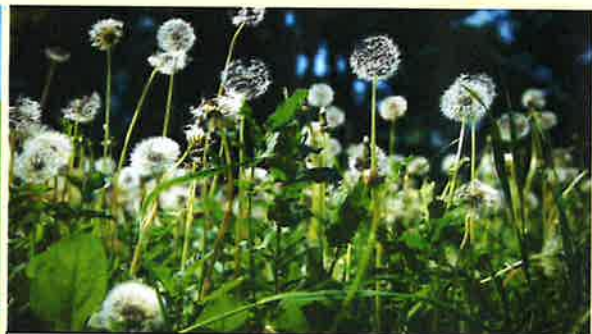
Les pissenlits blancs