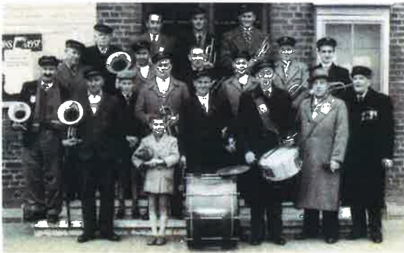
De la fanfare à la Société musicale...