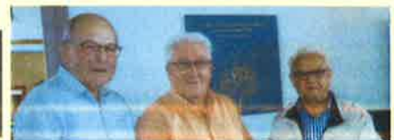
Les anciens membres du Bureau