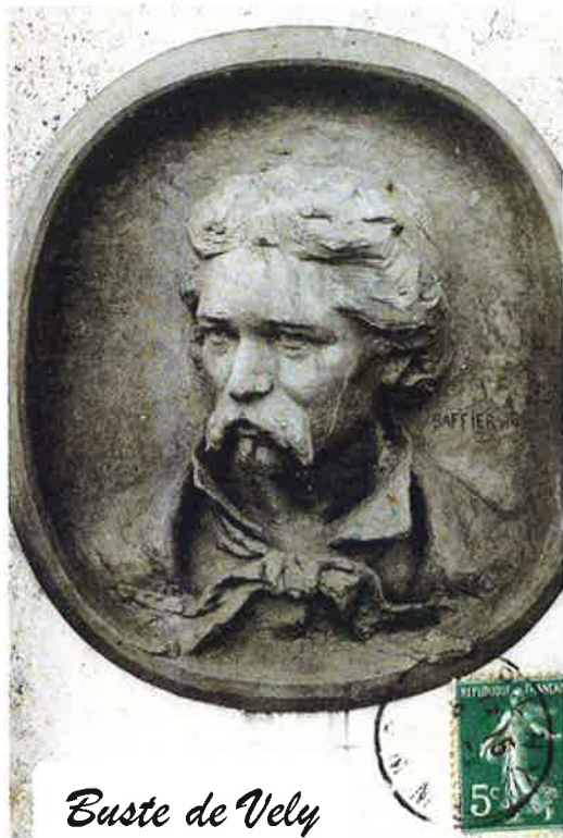
Buste de Vely

achetée par le Musée de Washington, Lucy de Lammermoor (1874), Méditation (1875), le Premier Pas (1877), L'Amour et l'Argent (1878), Le Cœur s'éveille (1880).