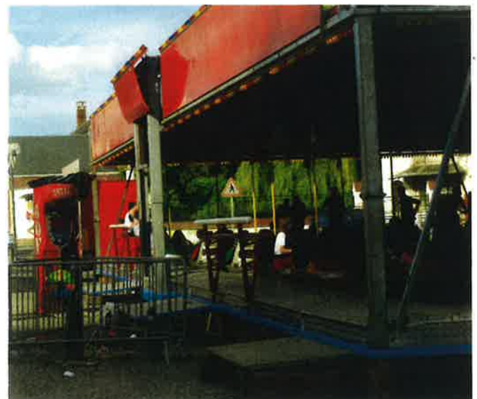
Les manèges pour la joie des petits et des grands