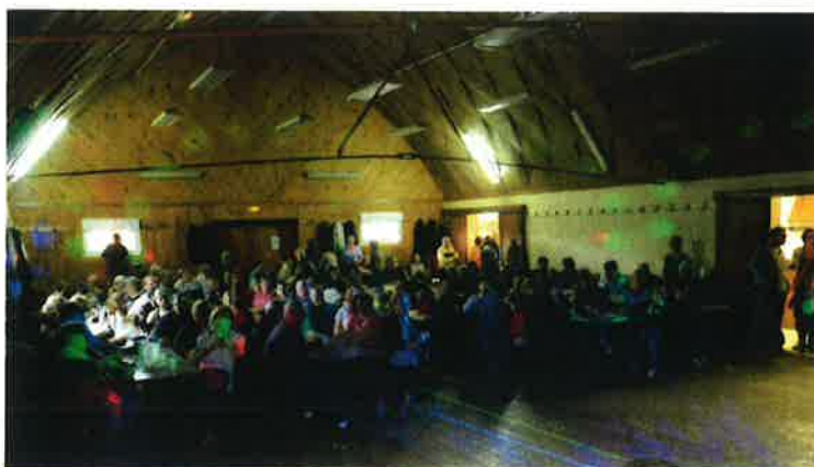
Un public nombreux

Nos élus ne se sont pas reposés sur leurs lauriers. Après la fête communale, ils ont enchaîné sur la fête de la musique. Cette première fête de la musique qui a été un succès ! Un encouragement pour les bénévoles mais aussi pour les artistes. Bravo et merci au public !