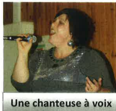
Une chanteuse à voix