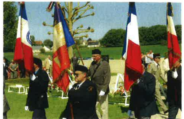
Les Associations d'Anciens Combattants