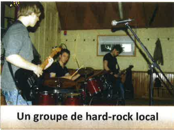
Un groupe de hard-rock local