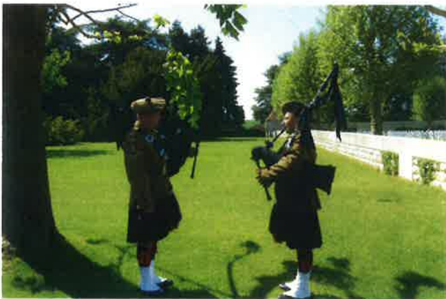
Les pipe bands