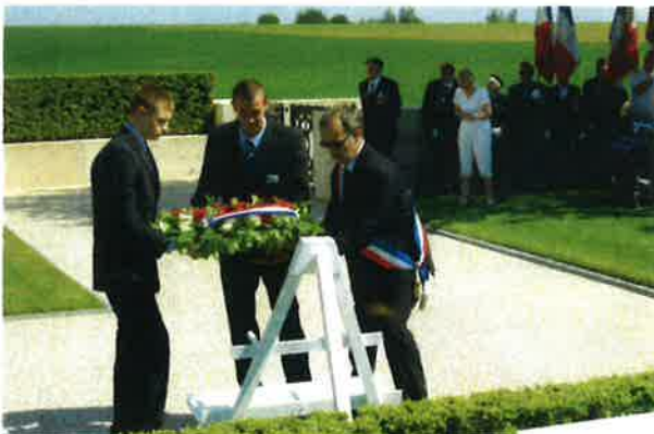
Le dépôt de gerbes