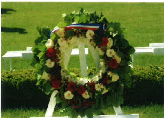
La gerbe de la Commune de Le Ronsoy