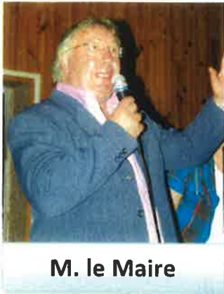
M. le Maire