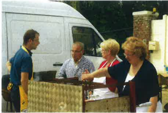
La présence des bénévoles

Beaucoup de préparatifs mais une réussite sous un soleil clément !