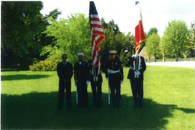
Les troupes militaires