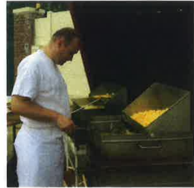
Un repas champêtre