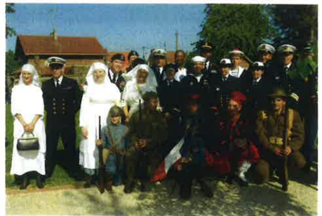
L'Association des GI's Memory